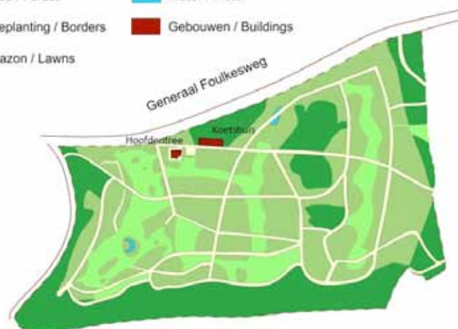
Botanische tuin Belmonte